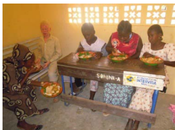
Les élèves déjeunent à l'école

Annie Fonteneau, au cours de son récent séjour, a pu observer les activités des élèves, et leur apprentissage dans les gestes de la vie : le repas de midi, la toilette des mains, l'accompagnement dans les déplacements.